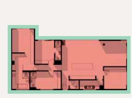
Type C(m) 4 Bedroom Penthouse

Unit 176.5m 2 Balconies 40.9m 2 / 43.5m 2