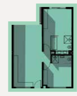
Type A 2 Bedroom Unit

Unit 75m 2 Balconies 13.8m 2 / 14.5m 2 / 23.6m 2