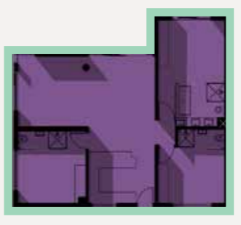
Type B 3 Bedroom Unit

Unit 75m 2 Balconies 13.8m 2 / 14.5m 2 / 23.6m 2