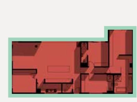
Type C 4 Bedroom Penthouse

Unit 110m 2 Balconies 18.3m 2 / 21.6m 2 / 35m 2 / 49m 2