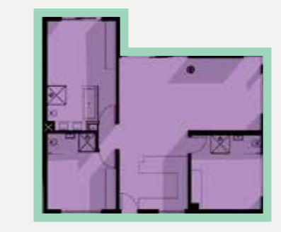
Type B(m) 3 Bedroom Unit

Unit 110m 2 Balconies 18.3m 2 / 21.6m 2 / 35m 2 / 49m 2